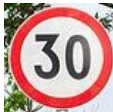
圖 4：限速 30 的標誌

接著通過 CNN 卷積神經網絡告訴電腦這張圖片中的標誌應該是屬於什麼速度的限制，準確率可達 99%。圖 5 是 CNN 卷積神經網絡的架構示意圖，