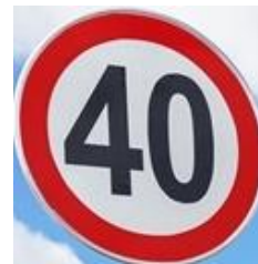
圖 3：限速 40 的標誌