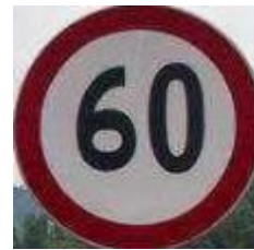
圖 2：經過處理的限速 60 的限速標誌

我先經過 Python 中的 Open CV 功能將鏡頭中所拍攝的圖片進行處理得到如圖 2 的結果，原理是通過讀取圖片中的圓形以及紅色區域，初步找到限速標誌的所在進行截取。圖 3 和圖 4 是不同限速標誌截取的結果，可以看出偏差不會太大。