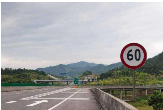
圖 1：限速 60 的實際路況

一般來講，開車要集中注意力，觀察道路情況。但是，真的能一直關注得到道路情況嗎？上課都還可能走神，開車難道不會走神嗎？當然我們不是在討論走神這個問題，當你認真的在開車的時候，專心致志的看著來往車輛，過往行人的時候，一不留神忽略了頭頂上的道路限速標誌，那該怎麼辦？這時又恰好是某些設計的很離譜的路段，原先全程 80 的限速，到這裡突然變成了 60，還有個測速攝像頭，你一無所知，等你回到家收到了一張罰單，被罰的莫名其妙，卻又百口莫辯，只能打碎牙齒往下吞。那麼，此研究就可以幫助你規避莫名其妙的超速的風險。