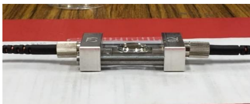
圖1. 金屬氧化物玻璃平板架設於對光平台上

為了測量玻璃平板感測器的穿透度與靈敏度，我們利用鹵素光源，藉由光纖引入到滴上待測液的玻璃平板上，最後將輸出光引入光譜分析儀進行